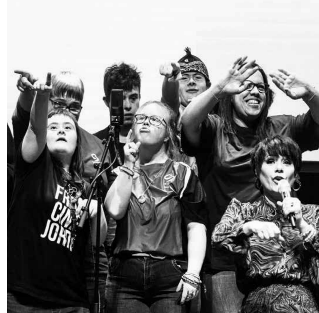
Benefizkonzert mit Francine Jordi